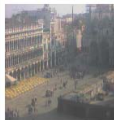
web-cam "Piazza San Marco" ("San Marco's Square" web-cam)

Nel Veneto i consumi dello scorso anno sono stati di 13 milioni di tonnellate che corrispondono all'undici per cento dei consumi nazionali. L'energia elettrica è prodotta per l'86 per cento con combustibili fossili e per il 14 per cento da fonte idroelettrica. "Entro il 2010 - ha spiegato l'assessore - il 22 per cento dell'energia dovrà essere originata da fonti rinnovabili." Sarà perciò necessario orientare meglio il comportamento degli utilizzatori sia pubblici che privati di energia, si dovranno anche prevedere incentivazioni finanziarie per potenziare l'uso di fonti rinnovabili, inoltre si dovrà puntare di più alle politiche di formazione e di informazione.