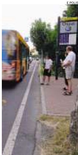
► Il Terraglio

Cinque cantieri per mettere in sicurezza altrettanti nodi lungo il Terraglio. I lavori coordinati e voluti dall'assessore alla Mobilità Enrico Mingardi partiranno il prossimo 11 maggio e prevedono la realizzazione di varie opere e manufatti per la messa in sicurezza degli attraversamenti e dei collegamenti pedonali in prossimità delle fermate bus lungo la trafficatissima via nel tratto compreso tra la scuola elementare di Villa Berchet e via Gatta. L'intervento da poco è stato appaltato all'Impresa So.Ge.Di.Co. di Zelarino, per un importo di poco meno di 200 mila euro. La durata prevista dei lavori è di 222 giorni, dopodiché l'asse stradale sarà sicuro, molto più sicuro per anziani, bambini e ciclisti. All'incrocio di via Gatta il progetto prevede la realizzazione di un percorso pedonale