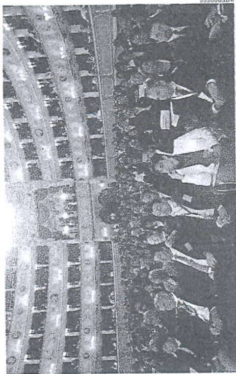
Insegnanti e studenti ieri hanno riempito il teatro La Fenice